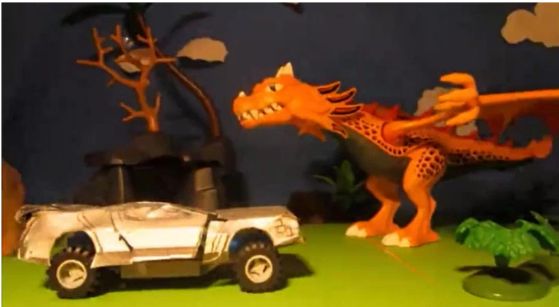
Filmbeispiel 2: Schülerfilm mit Hintergrundgestaltung

Der Film wird noch viel schöner, wenn du eine passende Dekoration im Hintergrund aufbaust, wie du an folgendem Beispiel sehen kannst: