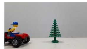
Filmbeispiel 1: Das fahrende Auto